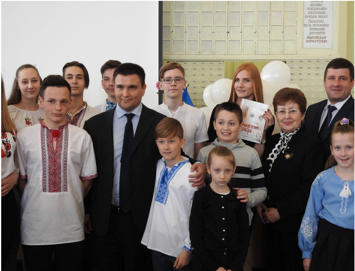
В. Д. Ракитянська з учасниками презентації міжнародного соціального проєкту «Книга Добра». Серед них: міністр закордонних справ України П. А. Клімкін ( другий зліва ). м. Харків, квітень 2019 р.